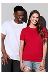
ST2020 Classic-T Organic