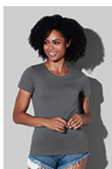
ST2620 Classic-T Organic